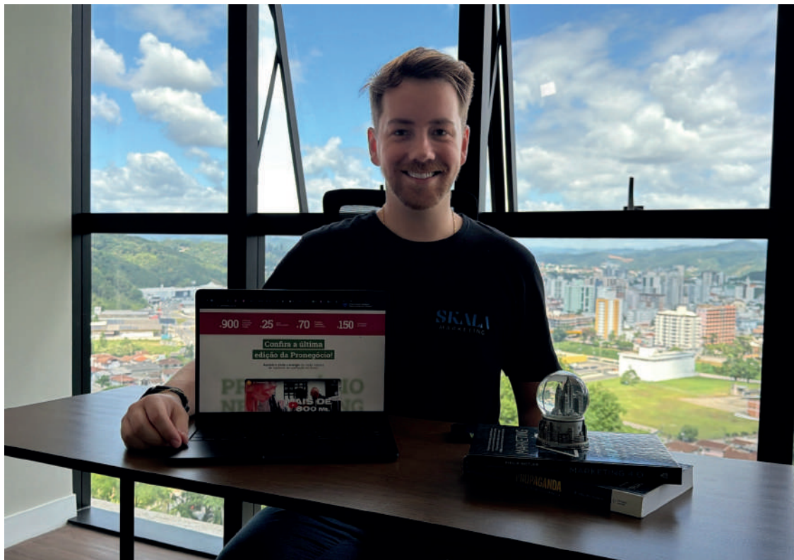
O trabalho com tráfego pago teve início em julho do ano passado

“Hoje temos um controle muito mais detalhado: histórico de compras, número de lojas, frequência de participação, contatos realizados e uma ficha técnica de cada lojista que participa da Pronegocio. Antes, esse mapeamento estava em torno de 50% ou 60%. Agora, estamos refinando esse processo para chegar