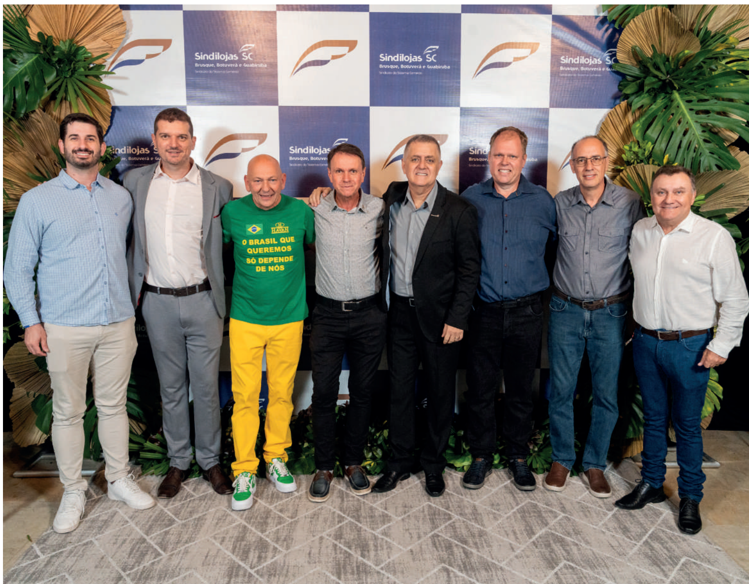
A solenidade reuniu diversas lideranças empresariais e representantes dos setores do comércio e de serviços da região